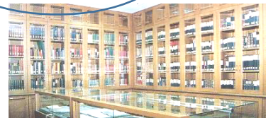
富山大学中央図書館 「ヘルン文庫」

15:30~ グループトーク 少人数で話し合い、意見交換します 16:10 閉会