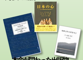
本会に関わった出版物

『ニューズレター』『へるん倶楽 部』等を届けます。月例会(輪読 会、イベント企画等)に参加でき ます。/年会費 一般3千円、大 学生以下無料。