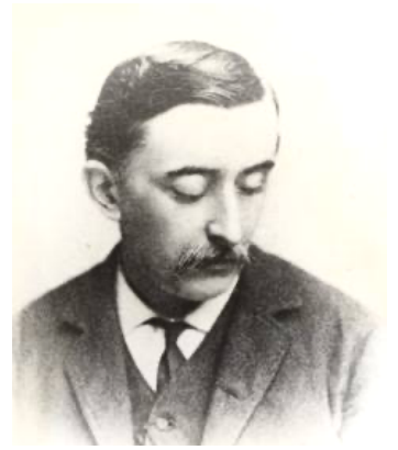
ラフカディオ・ハーン 愛称ヘルンさん 日本名小泉八雲